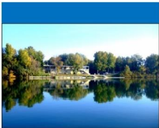
*Situation géographique de la SNA